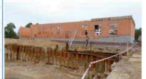
Foto: Roboty budowlane - teren oczyszczalni ścieków

Międzygminna Spółka Wodno-Kanalizacyjna „SUPLAZ” Sp. z o.o. Jednostka Realizująca Projekt ul. Pocztowa 7A, 59-375 Sulików tel./fax: (75) 72 23 442, www.suplaz-projekt.pl